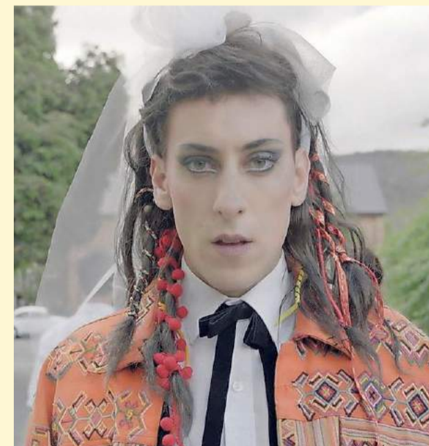
De Zuid-Afrikaanse komiek Schalk Bezuidenhout als Johan Niemand in 'Kanarie'.

Om zijn verstikkende geboortedorp toch te ontvluchten, gaat hij in dienst bij de Kanaries: het christelijke legerkorps van de krijgsmacht. Daar merkt Johan dat het ensemble vooral een propaganda-instrument is, dat