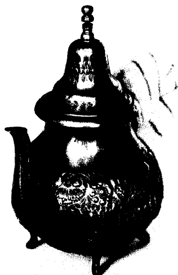
Theepot uit Marokko