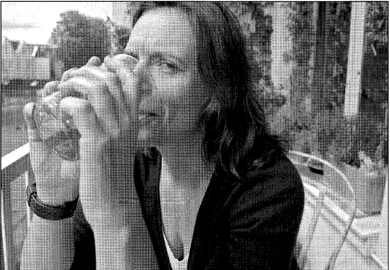
Threes Anna: 'Ben je als je één film hebt gemaakt een cineast? Ben je met één boek een auteur?'